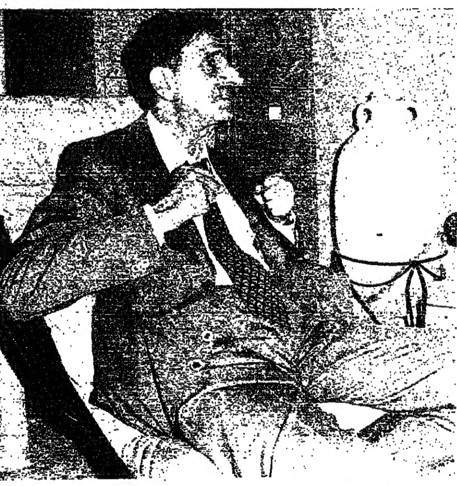
▲ مع الرئيس الأسد في كانون الاول ٧٥ ■